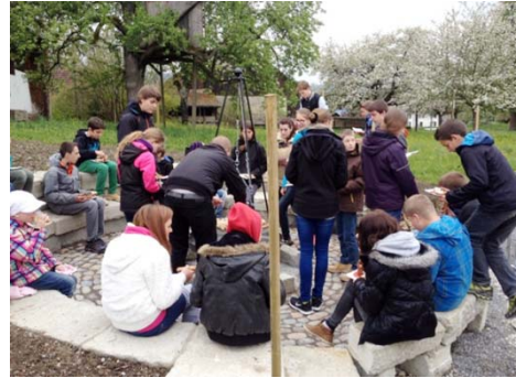
Einweihung der Feuerstelle

Das neue Atrium mit Feuerstelle vor dem Kirchgemeindehaus konnte in Betrieb genommen werden. Es ist sehr gelungen und viele Menschen haben Freude daran.