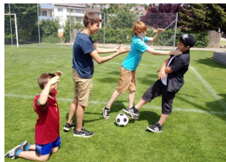
Szene im Jugendgottesdienst

Die Jugendgottesdienste wurden regelmässig am Freitagabend durchgeführt. Die Besucherzahlen sind jedoch merklich kleiner geworden. Sie brauchen jetzt eine Erneuerung.