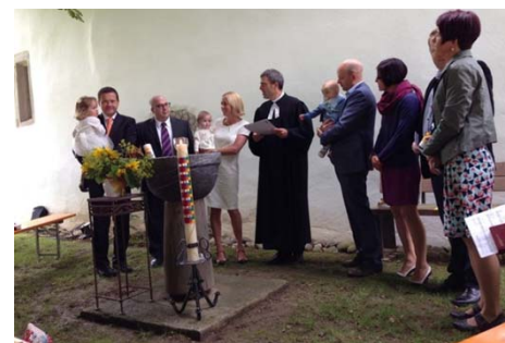
Taufe in Egliswil

In unserer Kirchgemeinde wurden 34 Kinder getauft und 47 Jugendliche konfirmiert. 4 Paare wurden getraut und 22 Verstorbene bestattet. 11 Personen sind in die Kirche eingetreten und 45 Personen ausgetreten. Per 31. Dezember zählte unsere Kirchgemeinde 3487 Mitglieder. Die Rechnung schloss mit einem Defizit von rund 38'000 Franken ab.