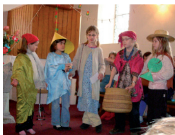
Kinder stellen Guyana vor

Die Mittagsgschicht-Kinder wurden im Februar erstmals eingeladen zur Vorbereitung des Kinder Weltgebetstages. 16 Kinder erfuhren an einem Mittwochnachmittag einiges über die Schönheiten und Schwierigkeiten in Guyana, Südamerika. Zum Thema „lose und handle hilft verstah“ gestalteten die Kinder danach die farbig-bige Weltgebetstagsfeier. Im Humbelhaus erwarteten Spezialitäten aus Guyana alle Anwesenden.