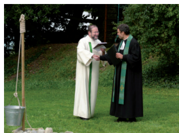
Abrahams und Lots Versöhnung