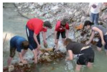
Stauen macht Spass

und die Kinder und Jugendlichen wurden mit einem von den Eltern organisierten Fahrdienst dahin gebracht. Höhepunkt des Jahres war bestimmt das Pfila in Aesch. Die Jungschi führten mit dem Velo dahin, verbrachten die Zeit in Zelten und beim Gold Suchen und erlebten tolle Gemeinschaft. Hoffentlich entwachsen unseren Jugendlichen wieder Leiter.