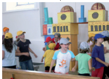
Freude in Ninive

Das Team war sich beim Anblick der fröhlichen Kindergesichter einig: die grosse Arbeit hat sich gelohnt. Der farbige Abschlussgottesdienst am Ende der Sommerferien war eindrücklich – das Hinarbeiten mit den Kindern auf den Familiengottesdienst haben alle als bereichernd empfunden.