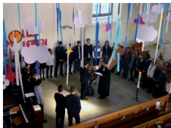
Gott begleitet dich

Zum Abschluss der Jugendarbeit wird die Konfirmation gefeiert. 64 Konfirmandinnen und Konfirmanden – eine Rekordzahl – bereiteten sich an drei Samstagvormittagen und einem Wochenende auf die Feiern vor. Sie wählten die Themen „Liebe“ und „Träume“ und gestalteten ansprechende Anspiele mit Theater, Tanz und Musik dazu.