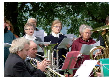
Impression vom Bettag