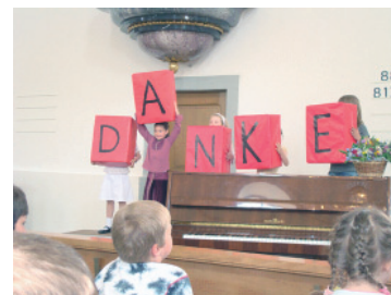
Pfingstgottesdienst „Bitte Danke Halleluja“

Im zweiten Quartal trafen sich 32 Kinder zum „Geschichte-Chor“. Die Geschichte des Turmbaus zu Babel und die Sprachverwirrung standen im Zentrum. So übten die Kinder in den Chorproben auch Lieder in Fremdsprachen. Im Gottesdienst entstanden aus dem gefallenen Turm zu Babel durch die Kinder die Hauptworte für glückliches Zusammenleben: Danke, Bitte, Halleluja. Traditionellerweise durften alle Frauen aus dem Gottesdienst ein von vielen freiwilligen Helferinnen gebundenes Sträusschen mit nach Hause nehmen.