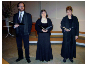
Die Solisten der Abendmusik