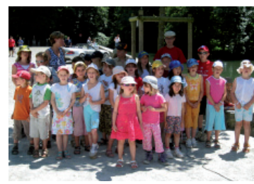
„Geschichte-Chor“ beim Schloss Hallwil

Am Samstag, 28. Juni, hat sich eine freudige Gruppe Kinder auf den Weg durchs Seetal gemacht. An verschiedenen Plätzen (Volg Seengen, Schiff, Seehotel Hallwyl, Satis Seon, Schloss Hallwil) erfreuten die Kinder die Zuhörer mit Liedern. Der Höhepunkt bildete die Einladung des Satis in Seon zum Zmittag: Die Heimbewohner tanzten und sangen freudig mit den Kindern um die Wette.