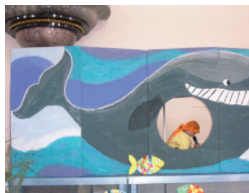
Jona im Fischbauch

nen Zmittag. Am Nachmittag erlebten alle ein abwechslungsreiches Programm: Spielnachmittag, Werknachmittag oder ein Zvieri im Fischbauch. Ein Höhepunkt der Woche war die Reise an die Bünz-Aue, wo die selbst gefertigten Schiffe gewässert wurden.