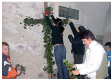
Das Osterkreuz wird geschmückt

unserer Gemeinde begleiten die Jugendlichen.