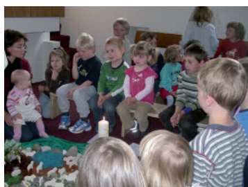
Fiire mit de Chliine, Kirche Egliswil

Die den kleinen Kindern bereits bekannte „Chilemuus“ und das Fiire Team hat an 6 Daten die 2-6 Jährigen und ihre Eltern zu einem kurzen Gottesdienst begrüsst: Am 12. März in Seengen (Trauer), am 27. April in Egliswil (Jesus und die Kinder), am 11. Juni in Seengen (Benjamin sucht den lieben Gott), am 3. September in Egliswil (Sturm), am 26. Oktober in Seengen (Der barmherzige Samariter) und am 10. Dezember in Boniswil (Frieden). Die „Fiire“ wurden jeweils von 25 bis 40 Kindern besucht. Die „Fiire“ haben immer den gleichen Ablauf, der den Kindern Heimat in der Kirche ermöglichen soll. Die Kinder hören die Orgel, singen, beten, bewegen sich, hören eine Geschichte und dürfen am Schluss auf ihren kleinen Kirchenbänken Zvieri essen.